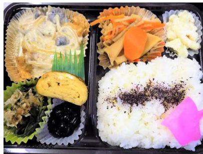
チキンのクリーム煮弁当