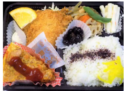
アジフライ・オムレツ弁当