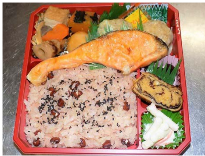
赤飯・シュウマイ弁当