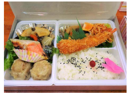
酢豚・シュウマイ弁当