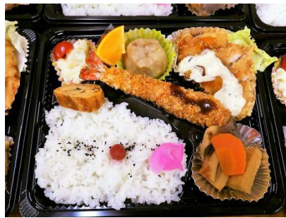
チキン南蛮・エビフライ弁当