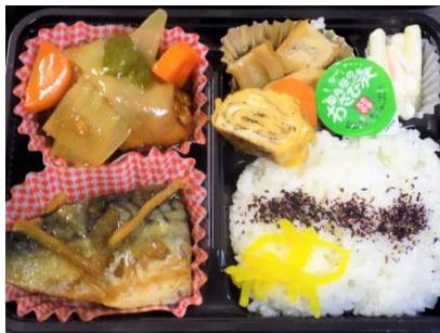
酢豚・さば味噌煮弁当